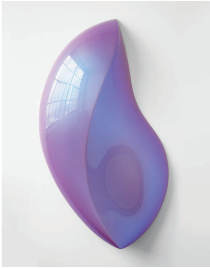
Satori – 2013, urethane on polyurethane block, 100 x 61 x 20 cm