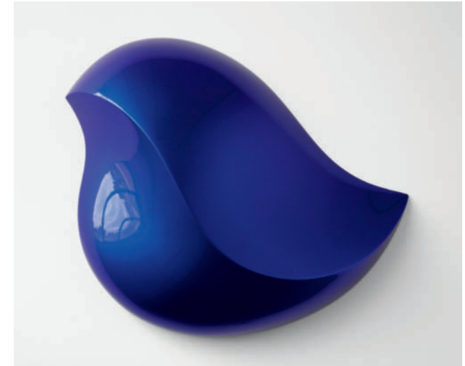
Brow – 2013, urethane on polyurethane block, 62 x 76 x 20 cm (siehe Detail Titel)