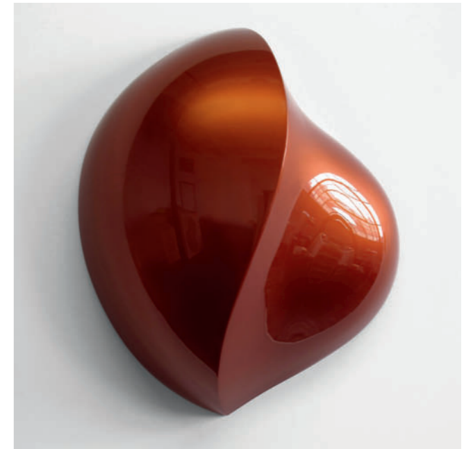
Nut – 2012, urethane on polyurethane block, 61 x 56 x 22 cm