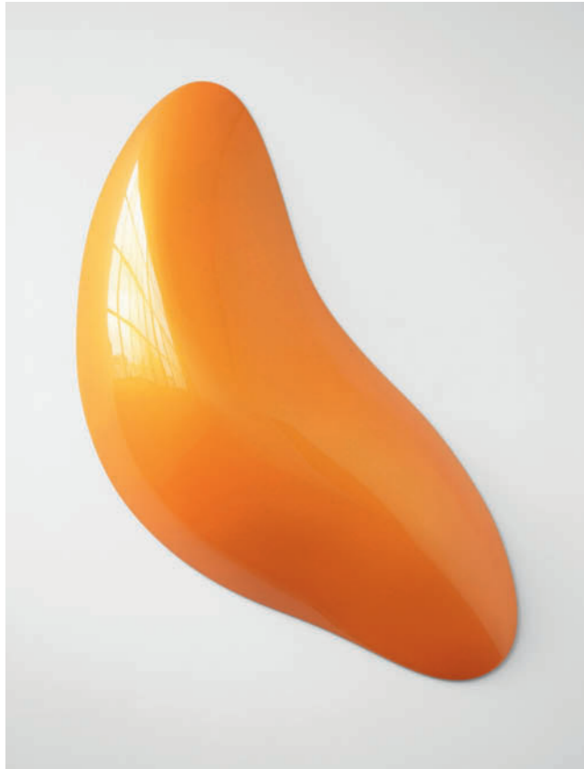
Oben/Top: Leap – 2013, urethane on polyurethane block, 102 x 76 x 17 cm Rechts/Right: Salute – 2013, urethane on polyurethane block, 35 x 57 x 28 cm