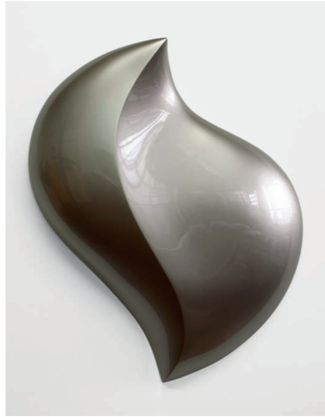
Armet – 2012, urethane on polyurethane block, 93 x 80 x 17 cm

„Thompsons Arbeiten entstehen in einem aufwändigen, handwerklichen Arbeitsprozess, bei dem die Objekte zunächst aus einem Polyurethan-Block heraus gearbeitet, dann mit bis zu zwanzig verschiedenen Schichten von Grundierungen und Autolacken überzogen und schließlich mehrfach poliert werden. Das Ergebnis sind selbstreferentielle Objekte, in denen ihre Eigenschaften – Form, Volumen, Farbe und Oberflächenstruktur – untrennbar zu einem Ding verschmolzen erscheinen. Als Dinge mit diesem besonderen Charakter können sie als eine Radikalisierung monochromer Malerei zu Specific Objects im Sinne der Definition von Donald Judd verstanden werden. Dabei gehen sie jedoch unter zwei Gesichtspunkten weit über diese Definition hinaus: Einerseits, weil sie ohne jedwede Referenz auf etwas Außerbildliches,