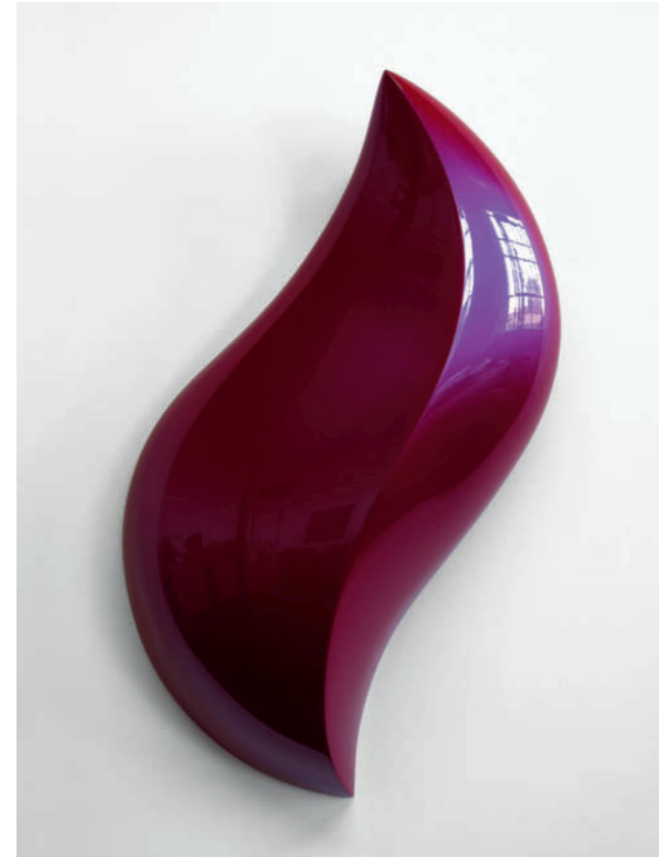
Herald – 2012, urethane on polyurethane block, 96 x 51 x 21 cm

“Thompson’s works are produced in a sophisticated and manually skilful process in which the forms are first carved out of a polyure-