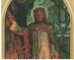
세상의 빛, William Holman Hunt作, 1904